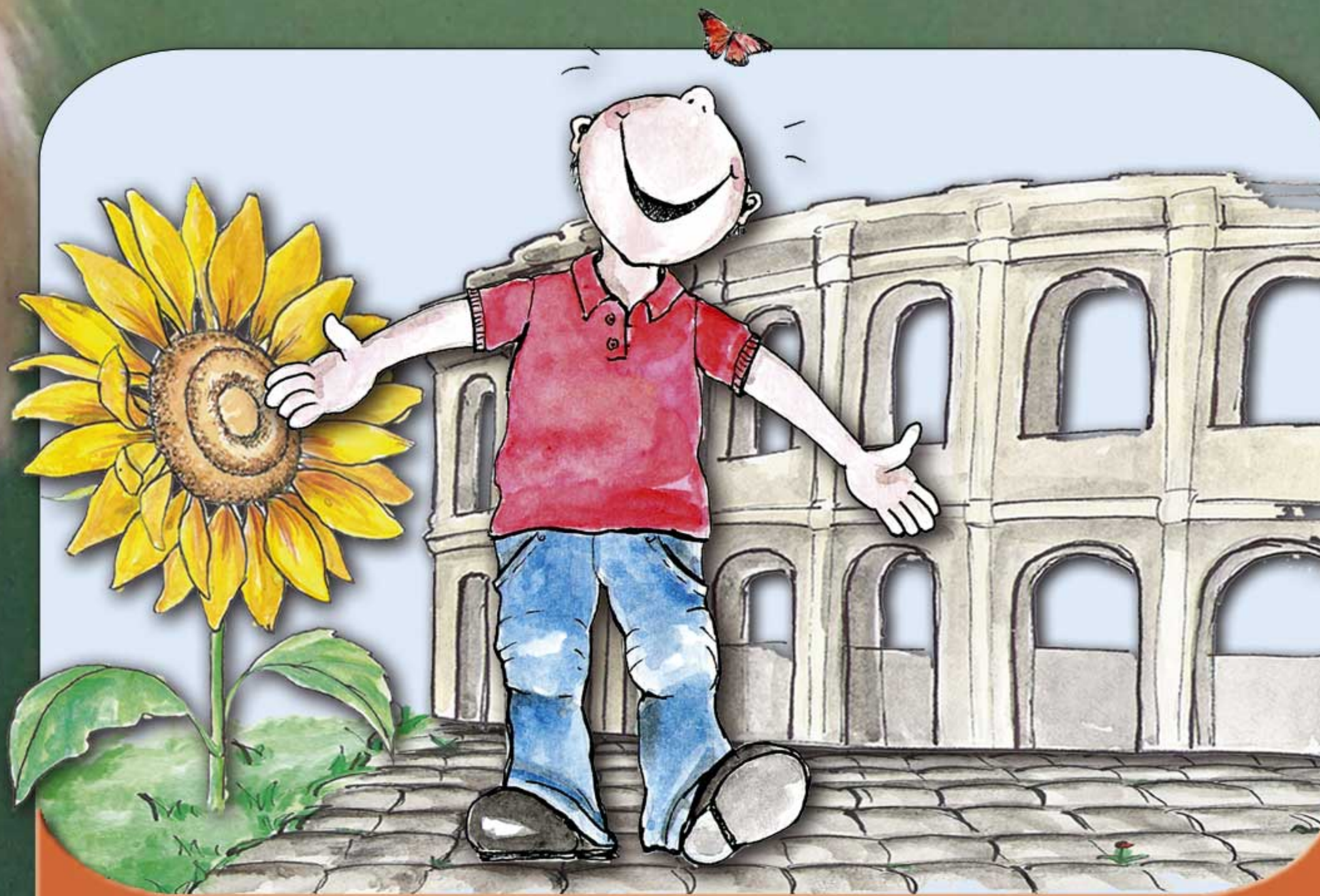
Mensch, Natur und Kultur

Der Fächerverbund Mensch, Natur und Kultur befördert die Neugierde der Schülerinnen und Schüler auf Naturphänomene, technische Zusammenhänge und die Freude am künstlerischen Gestalten.